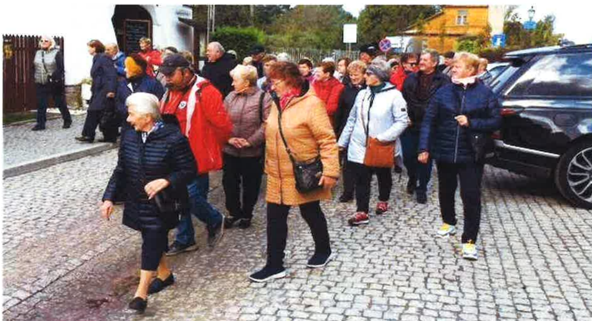
Wycieczka seniorów do Kazimierza Wielkiego i Naęczowa.